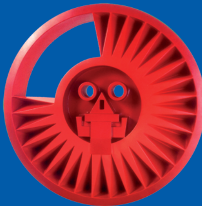
Mictlantecuhtli. Plaza de San Diego

Universidad Nacional Autónoma de México Parque Municipal de Servicios y Policía Municipal del Ayuntamiento de Alcalá de Henares