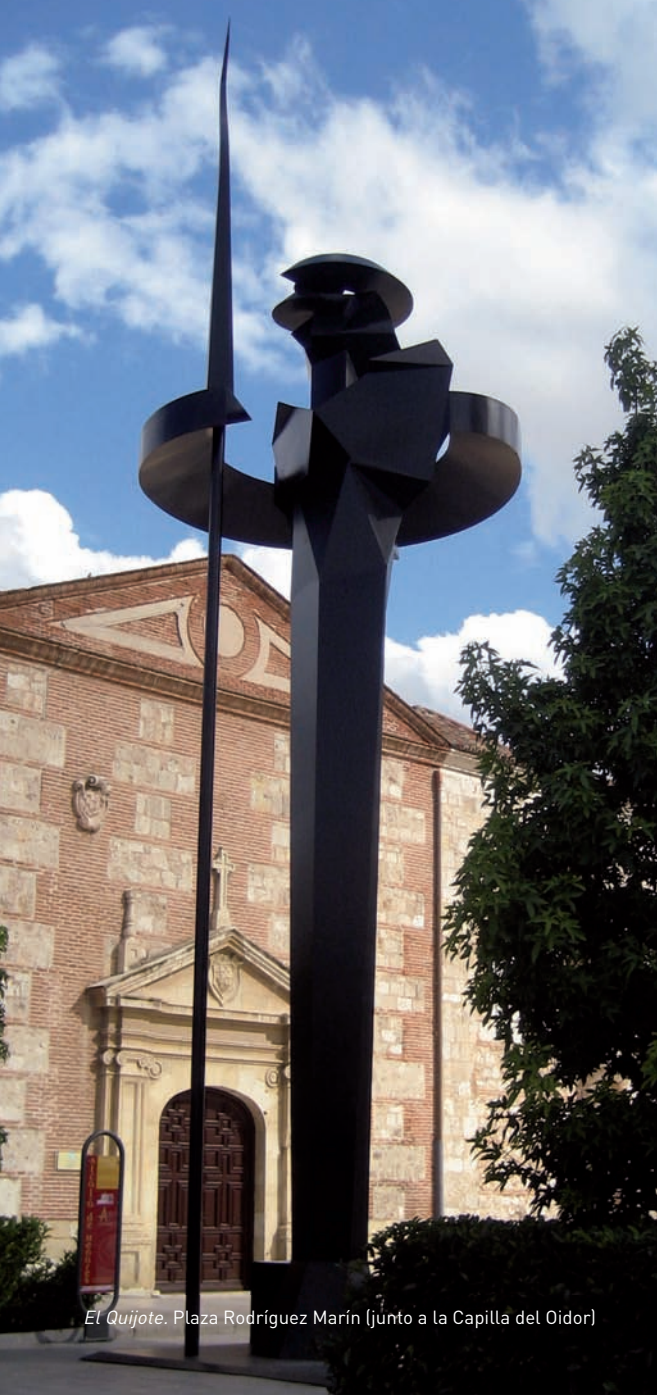
El Quijote. Plaza Rodríguez Marín (junto a la Capilla del Oidor)