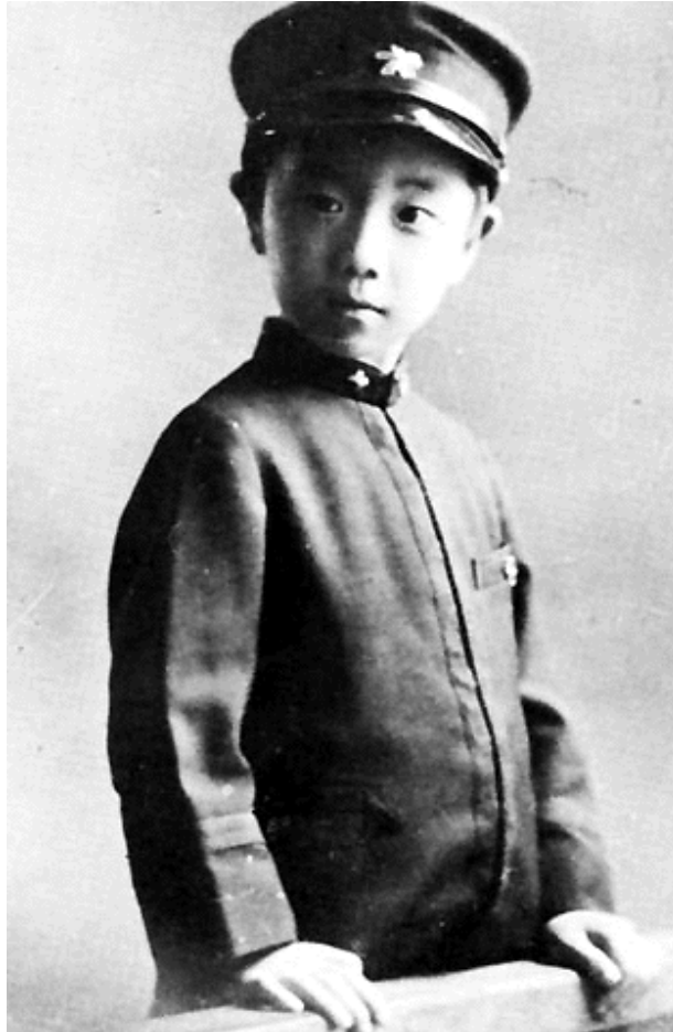
Yukio Mishima 1931.