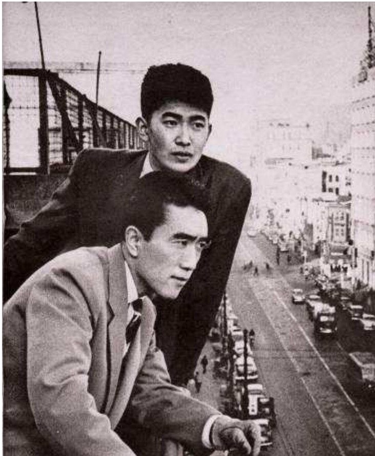
Yukio Mishima y Shintaro Ishihara.

Generacionalmente es considerado parte de la “segunda generación” de escritores de posguerra, junto con Kobo Abe.